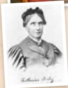
Katharina Prato in jungen und späteren Jahren